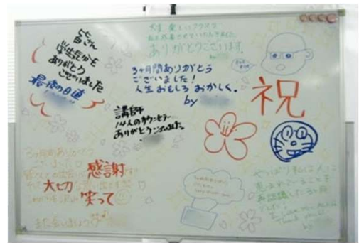
（修了受講生の寄せ書き）