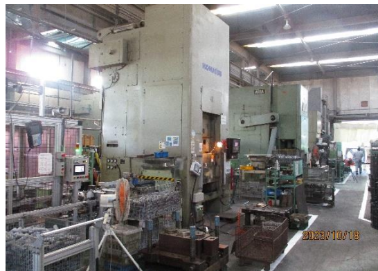
プレス工場内写真

30代から40代の中途社員が多く活躍しています。やる気があれば資格取得や技能検定の受験など会社が全面サポートします。