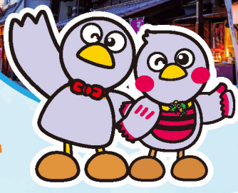
埼玉県マスコット「コバトン」「さいたまっち」