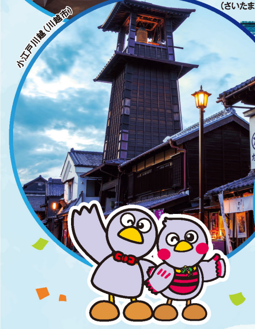
小江戸川越 (川越市)