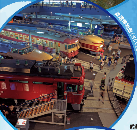
鉄道博物館 (さいたま市大宮区)

年次有給休暇を取得して、 家族と過ごしたり、 地域の活動に参加したり、 新しい働き方・休み方を はじめましょう。