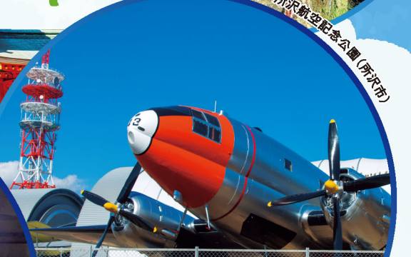
所沢航空記念公園 (所沢市)