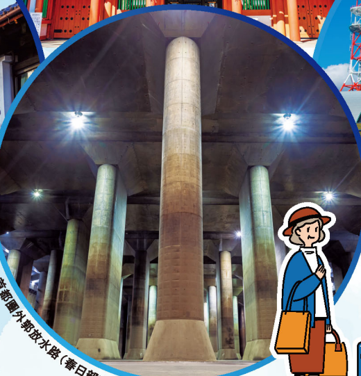
首都圏外郭放水路 (春日部市)