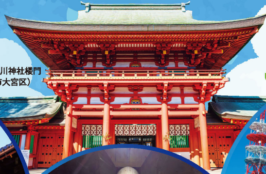
武蔵一宮氷川神社楼門 (さいたま市大宮区)