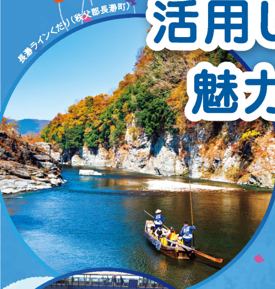
長瀬ラインくた (秩父部長瀬町)