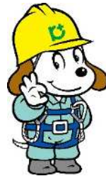
建設業労働災害防止協会 PRキャラクター 「ホビー君」