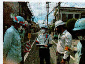
現場巡回実施状況