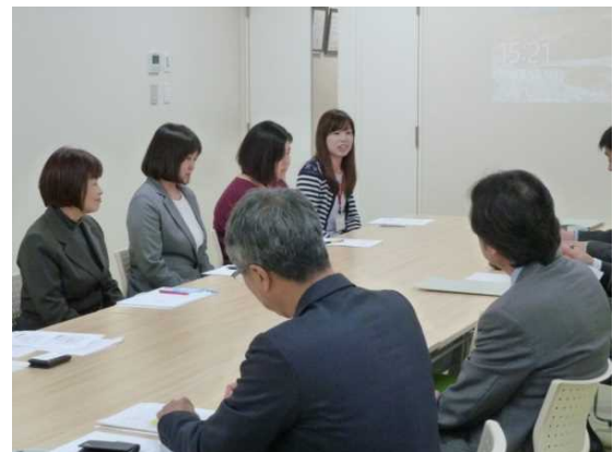
＜ 木塚労働局長と社員の方々との意見交換の様子 ＞