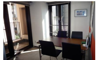
面談ルームで専任コーディネーターがマンツーマンでご希望を伺います！