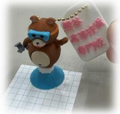
3Dプリンタを活用!! くませんくん ペーパーウエイト