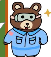
熊谷高等技術専門校 マスコット