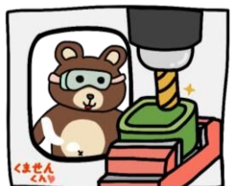
マシニングセンタ