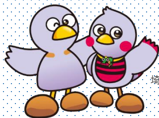
埼玉県のマスコット 「コバトン」 & 「さいたまっち」