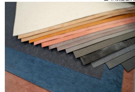
製品 ビーターシート各種