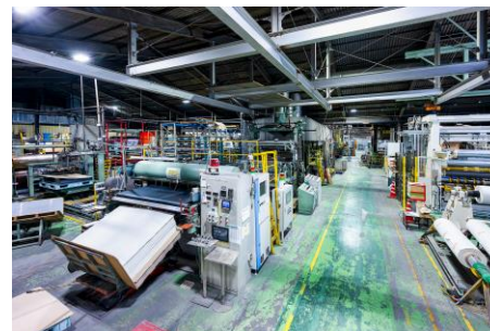
1号抄造機 全長80メートルくらい