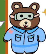
熊谷高等技術専門校 マスコット