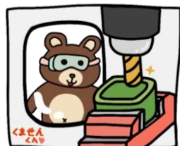
マシニングセンタ