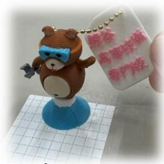
3Dプリンタを活用!! くませんくん ペーパーウエイト