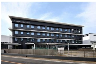
トーヨーケム川越製造所