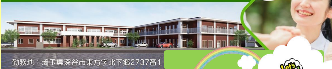
勤務地：埼玉県深谷市東方字北下郷2737番1