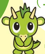
さいたま市 PRキャラクター 「つなが竜ヌゥ」