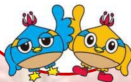
日高市 マスコットキャラクター くりっかー・くりっぴー

日高市生涯 学習センター（図書館） 2階視聴覚室・研修室 (日高市大字鹿山370-20)