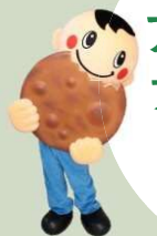
草加せんべいマスコット バリポリくん