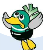
越谷特別市民 「ガーヤちゃん」