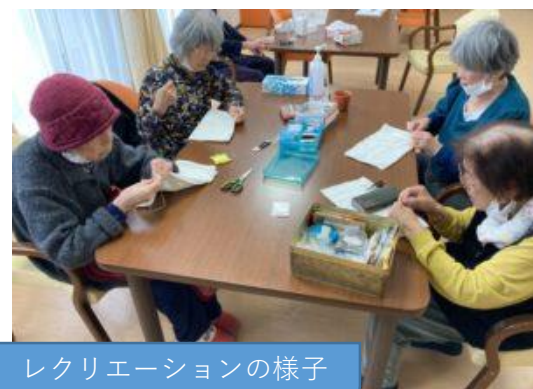
レクリエーションの様子