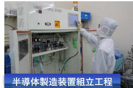
半導体製造装置組立工程