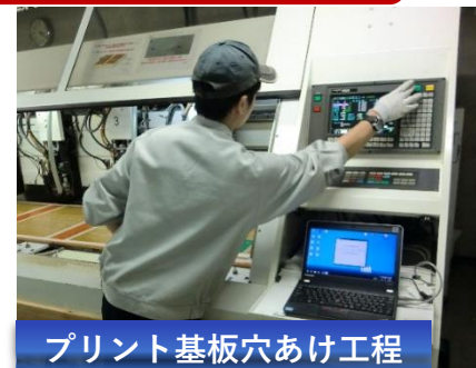
プリント基板穴あけ工程