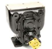
タンクローリー用ポンプ