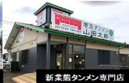
新業態タンメン専門店