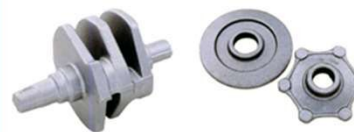
クランクシャフト リングギア・ファイナルドリブフランジ