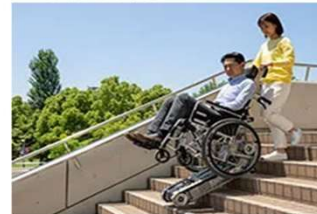
可搬型階段昇降機