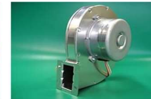
DCターボファンモータ

「品質とコストパフォーマンス」をモットーに、創業以来70年以上で培った技術と知識を各種製品に集約させています。