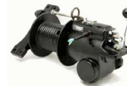
車輛運搬用ウインチ