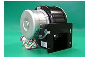
DCシロッコファンモータ