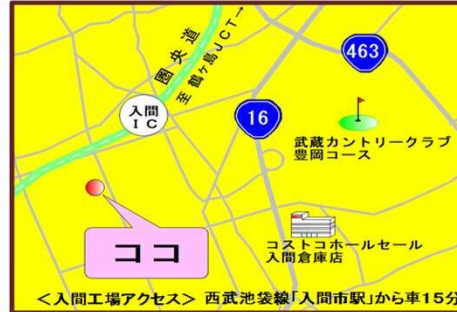
<入間工場アクセス> 西武池袋線「入間市駅」から車15分

機械事業では、お菓子を作るための機械である「製菓機械」を開発・製造しています。具体的には、全自動でどら焼やサンドイッチパンケーキなどを製造する「直焼焼成機」、様々なお菓子の生地絞りや仕上げをする「充填成型機」、おいしく焼きあげたり蒸しあげたりするための「オーブン」や「スチーマー」などがあり、いずれも独自のノウハウが詰め込まれたオリジナル製品です。また、包装机や検査機器を扱う関連機械メーカーと連携することにより、一貫生産ラインの構築も行っています。こうした様々な活動を通じ、お客様に安全・安心でおいしいお菓子を適正コストで安定生産できる体制をお届けすることが、機械事業の使命です。