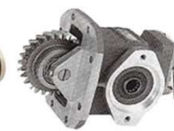
P. T. O