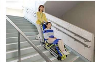
非常用階段避難車