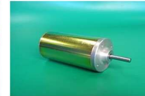
ブラシ付きDCモータ