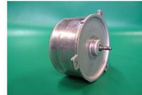
ブラシレスDCモータ(Φ88)