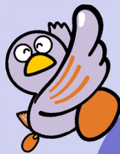
埼玉県マスコット「コバトン」

業務を拡大し広く人材を募集する地域企業が参加！ 各企業の人事担当者による個別面談や相談が受けられます！