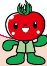
北本トマト イメージキャラクター とまちゃん