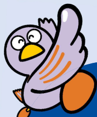
埼玉県マスコット 「コバトン」

業務を拡大し広く人材を募集する地域企業が参加！ 各企業の人事担当者による個別面談や相談が受けられます！