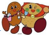
〔R〕行田市 マスコットキャラクター 『こぜにちゃん・フラべえ』