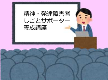
精神・発達障害者 しごとサポーター 養成講座

※講師謝礼等の費用は一切かかりません。 ※最少開催人員は10名程度を予定しています。 ※所要時間については可能な範囲で要望に応じます。 ※開催日などご要望にお応えできない場合があります。