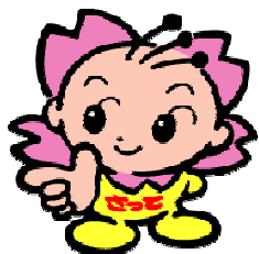
幸手市マスコットキャラクター さっちゃん