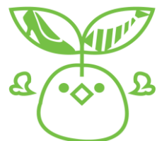
佐賀新卒者等就職応援 シンボルマーク