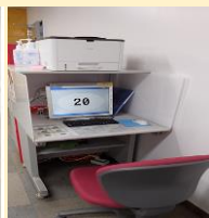
◎パソコンが苦手な方 (紙ファイルで机に設置)