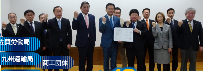
価格転嫁の円滑化に関する連携協定締結式