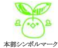
本部シンボルマーク