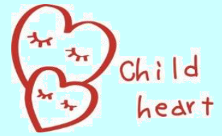
季節のイベント活動