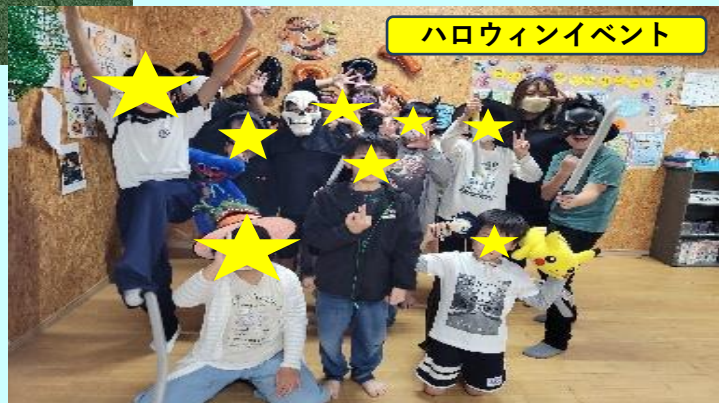
ハロウィンイベント