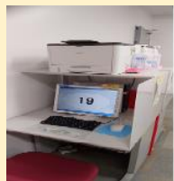
◎求人検索用にパソコンを2台設置