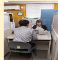
◎職業相談窓口 (2名体制)