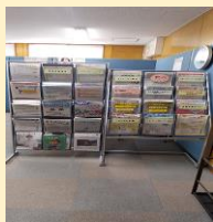
◎求人情報紙等設置 (毎週水曜日発行)

※「紹介状」の交付の前に、ご本人が事業所の職場見学を希望される場合は、事業所のご理解のもとに職場見学の依頼にも取り組んでいます。また、場合によっては、学歴や経験、資格等の募集条件について、求人条件の緩和など依頼を求人事業所にご相談も行っています。