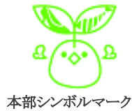
本部シンボルマーク