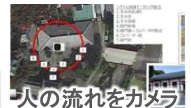
人の流れをカメラ で常時分析！