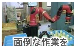
面倒な作業を ロボットにお任せ！