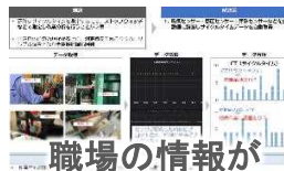
職場の情報が スマホで見れる！