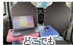
どこでも 働ける環境に！