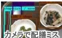
カメラで配膳ミス をチェック！