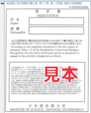
旅券に添付された指定書▶

在留資格が「特定技能1号」、「特定技能2号」の場合には分野を、 在留資格が「特定活動」の場合には活動類型を、 旅券に添付されている指定書(右参照)でそれぞれ確認し、 下表のうちいずれかを、在留資格欄に記入してください。