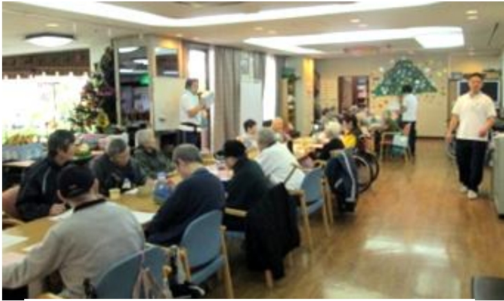
ビンゴ大会を楽しむ入居者（守口市内の特別養護老人ホーム）

大阪新卒応援ハローワークは2月3日午後1時から、介護・福祉業界の企業面接会を開く。高齢化が進む中、介護関連の職種は、年間を通じて募集しているケースが多く慢性的な人手不足が悩みだ。介護・福祉系学科の卒業生だけでは充足できず、内定者には介護職員初任者研修の費用などについて支援する企業もある。2025年には65歳以上の高齢者人口は3657万人と予測される。超高齢化社会を支える若い人材への期待は大きい。