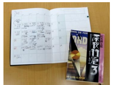
予定で埋まった手帳と息抜きの本

9月の終わり、旅行会社2社の最終選考に進む。悩んだ末、自分が志望したのは規模が小さい方の会社だった。社員