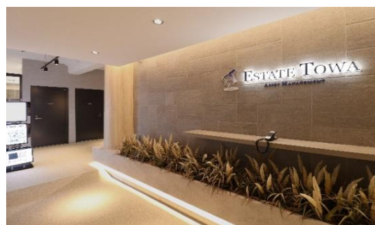
大阪本社エントランス