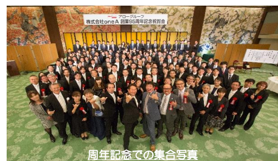
周年記念での集合写真

2007年にグループ会社を統合（アサヒ・アロー） 「ひとつのA」「トランプのエース」の意味を表しています。