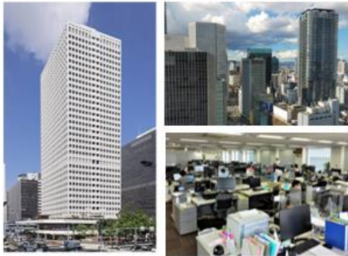
<事業所の様子と事業所から見える風景>