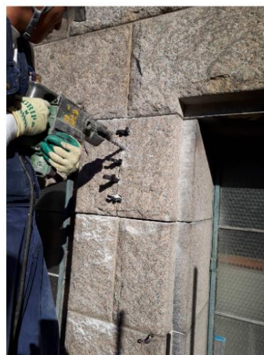
再生保存工事壁石割作業