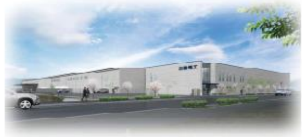
新工場完成予想パース