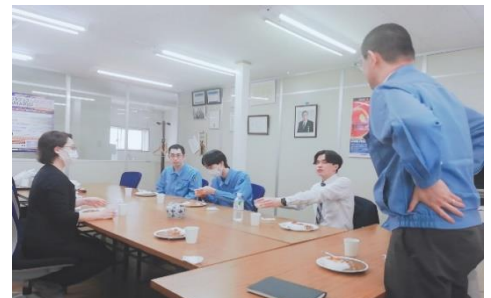
若手社員と社長とのランチは毎月開催

採用面接で中央電機計器製作所を訪問した際に、互いに連携を取りながらいきいきと仕事をしている様子を拝見し、私も中央電機計器製作所で働いてみたいと思いました。また、学生時にモノづくりを体験し、ソフト、ハードを一貫して開発している中央電機計器製作所で働きたいと感じました。