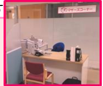
専門スタッフがきめ細やかな 職業相談をさせていただきます。 (写真はハローワーク枚方 マザーズコーナー)