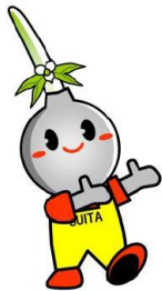
吹田市 イメージキャラクター すいたん

吹田市と国（大阪労働局）が一体となって 大学生等の若者及び子育て女性等を支援します！！ 「吹田市雇用対策協定」締結！