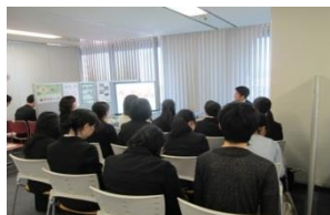
企業と学生・既卒者の 出会いの場

大阪新卒応援ハローワーク内セミナールームで テーマを決め開催される複数社参加の企業説明会。