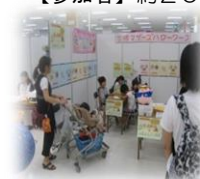
ごほうびフェスタの様子

【日時】平成28年7月3日(日) 【場所】イトーヨーカドー津久野店 【参加者】約200名 (うちお子様50名)