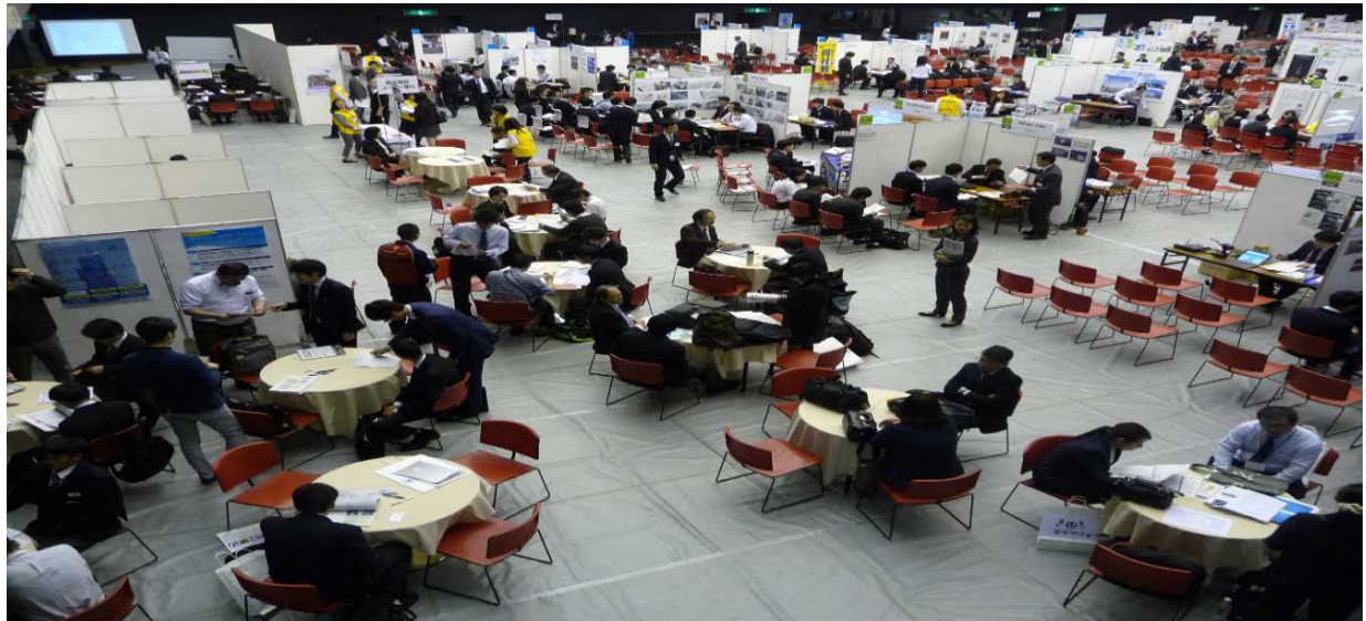
～過去の合同求人説明会の様子～

高校生の皆さまは職業理解や就職活動へのモチベーションが向上し、興味がある職種の企業を発見することができます。