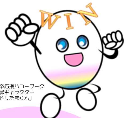
大阪新卒応援ハローワーク 公認キャラクター 「ドリたまくん」

※予告なくオンライン参加に切り替える可能性もございます。あらかじめご了承ください。