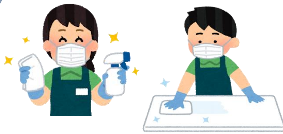
共用物品の定期的な消毒