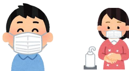
職員のマスク着用、手指の消毒