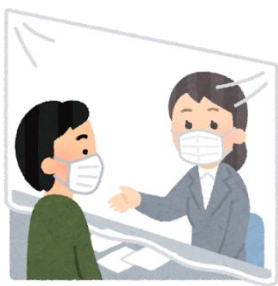
窓口に飛沫防止シート・アクリル板を設置