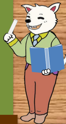
大阪労働局 需給調整事業部 マスコットキャラクター 「ハケン君」