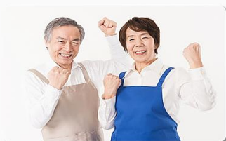
求職者ひとりひとりの気持ちになり徹底的にサポート

地域密着で地元の非公開求人情報もご提案致します。希望の職場が見つかるまで徹底フォロー。