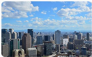
地域密着で満足度UP

地域密着で地元の非公開求人情報もご提案致します。希望の職場が見つかるまで徹底フォロー。