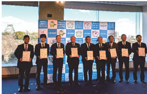
▲大阪府の政労使が共同メッセージを採択「大阪政労使会議」（令和8年1月開催）